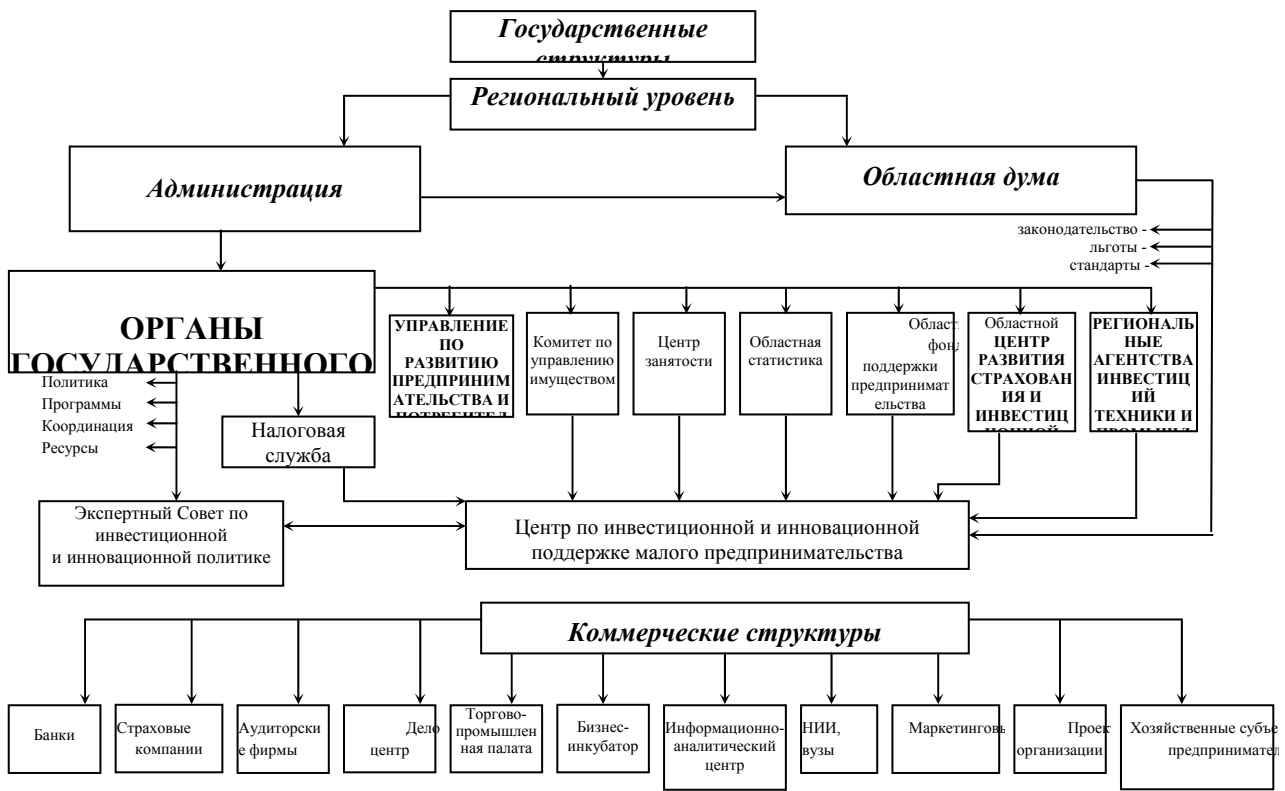
Рисунок 2 – Предлагаемая модель взаимодействия Центра с другими субъектами, участвующими в формировании инвестиционной программы