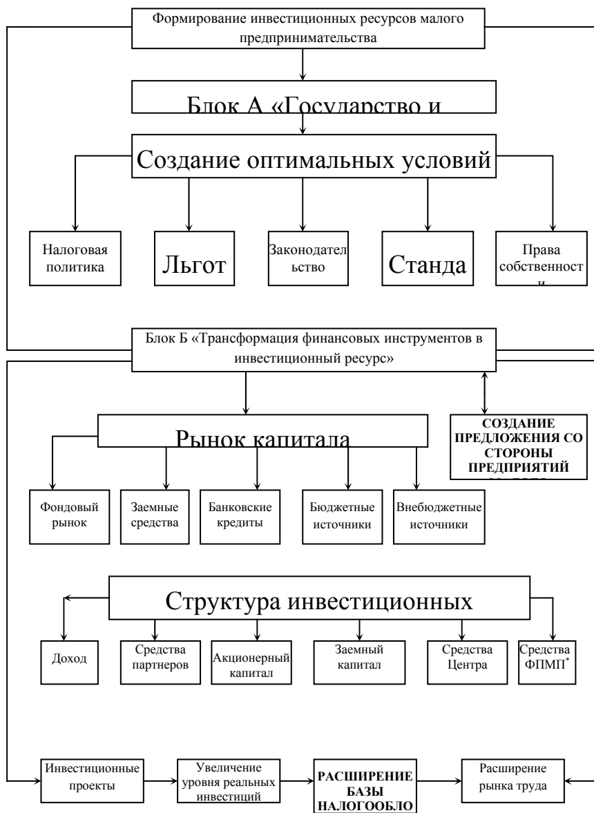
Рисунок 3 – Формирование источников инвестиций для малых предприятий

(* – фонд поддержки малого предпринимательства)