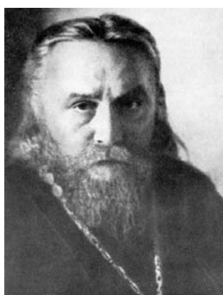
БУЛГАКОВ С. Н.