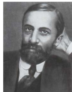
МЕРЕЖКОВСКИЙ Д. С.