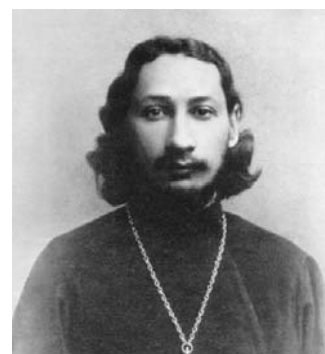
ФЛОРЕНСКИЙ П. А.