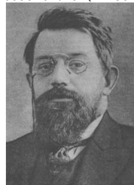
П. Б. СТРУВЕ

А.М. Горький еще задолго до знакомства с Богдановым и Луначарским высказывал мысли о том, что бог – это частица разума и сердца человека, а человек – вместилище бога, понимаемого как неукротимое стремление к совершенствованию, истине, справедливости. Если в начале своей творческой деятельности Горький воспевал романтический индивидуализм, восхищаясь бунтарями, гордыми сознанием своей личности, то под влиянием Богданова он изменил свои взгляды. Смысл жизни он увидел в приобщенности к великому человеческому коллективу, в растворении «Я» в океане человеческих стремлений, горя и радости. Богданов укрепил Горького в мысли, что не мечта, а накопление опыта победит мерзость жизни и облагородит человека. В 1908 г. в «Исповеди» Горький писал: «Вот просыпается воля народа, соединяется великое, насильно разобщенное, уже многие ищут, как слить все силы земные в единую, из нее же образуется, светел и прекрасен, всеобъемлющий бог земли».