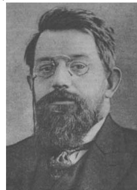
П. Б. СТРУВЕ

А.М. Горький еще задолго до знакомства с Богдановым и Луначарским высказывал мысли о том, что бог – это частица разума и сердца человека, а человек – вместилище бога, понимаемого как неустранимое стремление к совершенствованию, истине, справедливости. Если в начале своей творческой деятельности Горький воспевал романтический индивидуализм, восхищаясь бунтарями, гордым сознанием своей личности, то под влиянием Богданова он изменил свои взгляды. Смысл жизни он увидел в приобщенности к великому человеческому коллективу, в растворении «Я» в океане человеческих стремлений, горя и радости. Богданов укрепил Горького в мысли, что не мечта, а накопление опыта победит мерзость жизни и облагородит человека. В 1908 г. в «Исповеди» Горький писал: «Вот просыпается воля народа, соединяется великое, насильно разобщенное, уже многие ищут, как слить все силы земные в единую, из нее же образуется, светел и прекрасен, всеобъемлющий бог земли».