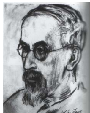
С. Л. ФРАНК

В рамках философии всеединства возможно воссоздание целостного облика предмета по какому-либо одному из его «моментов». Карсавин предпочитал анализировать национальную религиозность, поскольку усматривал в религии важнейшую сферу человеческой жизни. В различном толковании Западной и Восточной церквами догмата троичности мыслитель видел истоки всех дальнейших расхождений западноевропейского и русского культурных миров. Католическое учение об исхождении Духа Святого «и от Сына» (филиокве) приводит, по его мнению, к принижению Духа. Отсюда проводится прямая линия к характерным особенностям западного строя мышления: идее границ человеческого разума, таким ее чертам, как рационализм, эмпиризм, релятивизм. С этим же догматом Карсавин связывал возникновение в западной духовности разрыва между абсолютным и относительным, породившего отказ от веры в совершенную небесную жизнь и сосредоточение интересов на идеале земного благополучия.