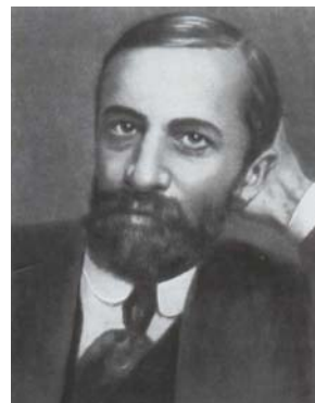
Д. С. МЕРЕЖКОВСКИЙ

нить это мог другой духовный опыт, тот, который выработал русский народ, как один из основных носителей православной культуры.