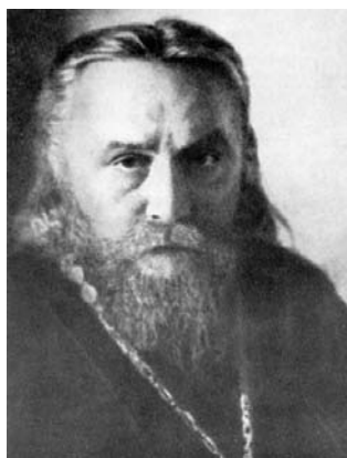
С. Н. БУЛГАКОВ