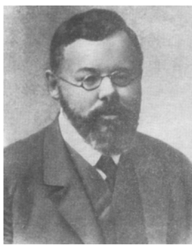
М. И. ТУГАН-БАРАНОВСКИЙ