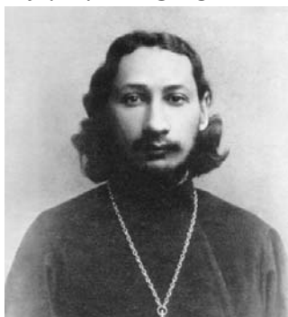
П. А. ФЛОРЕНСКИЙ