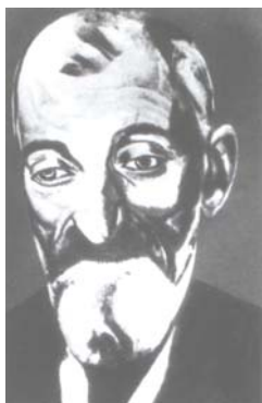
Л. И. ШЕСТОВ