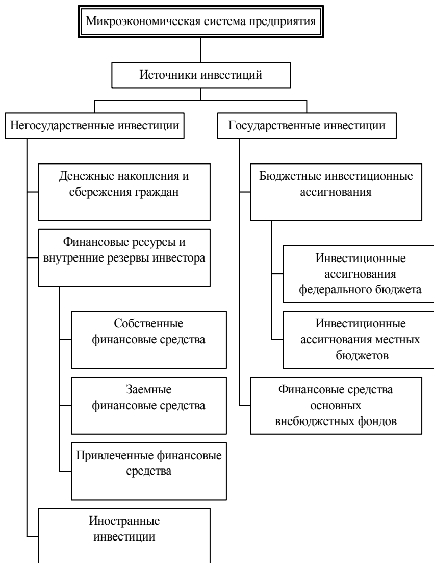
Рис. 1 Основные источники инвестиций в развитии микроэкономической системы предприятия 1 Структура источников инвестиционного процесса в негосударственном секторе (по состоянию на 1 января 2002 года)

Следует отметить, что износ производственных фондов в России по ряду отраслей достиг 75 %. Общая потребность в инвестициях для обновления физически изношенного производственного аппарата составляет 2900 ... 3200 млрд. р. Поэтому проблема поиска предприятиями доступных источников инвестиций в настоящее время приобретает особую актуальность. Структура негосударственных инвестиций представлена в табл. 1.