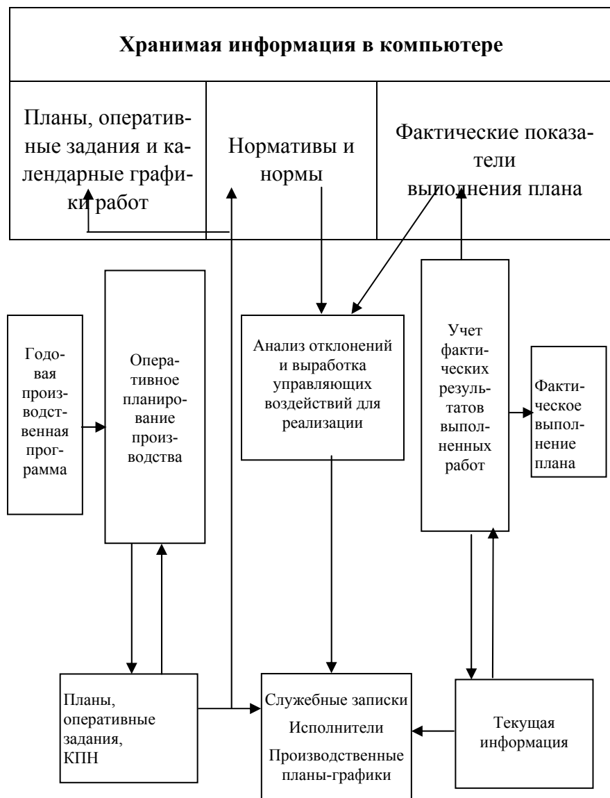
Рис. 3 Информационная модель управления промышленным производством с использованием сетевых технологий

обработку первичных данных, что ведет к снижению общих издержек производства и увеличению прибыли.