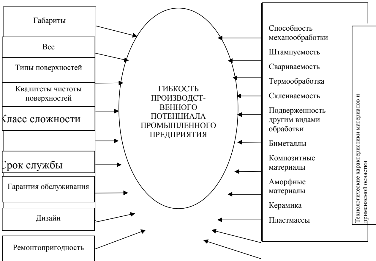
Рис. 1 Параметры и характеристики, определяющие гибкость производственного потенциала предприятия