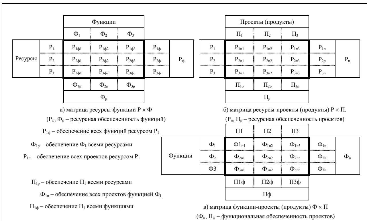
Рис. 1. Матрицы оценки состояния потенциала предприятия

Следует учесть сложность взаимосвязи функций и ресурсов: так, трудовые ресурсы необходимы для выполнения каждой функции, в том числе и для функций управления, но для развития этого вида ресурса необходимы, в свою очередь, функции управления. Поэтому в качестве ресурсов, кроме финансовых, материально-технических, трудовых и информационных, принимаются в расчёт организационная структура, технология процессов выполнения функций и опыт решения задач в данной области.