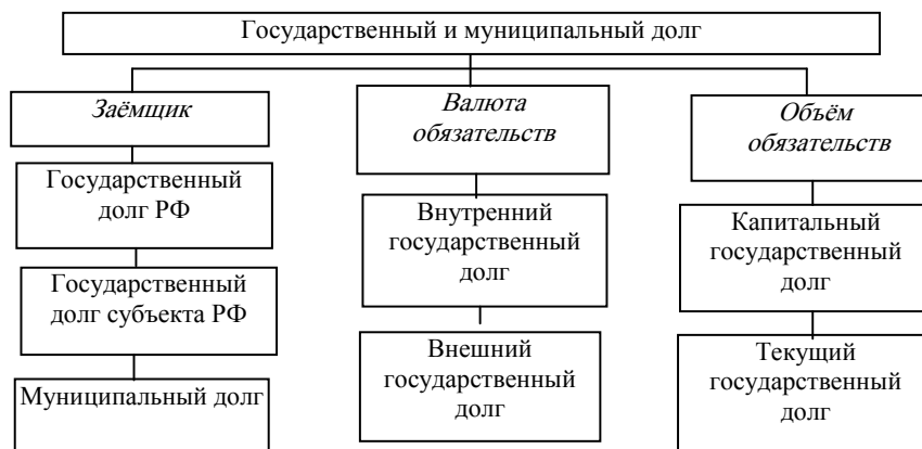
Рис. 3. Классификация государственного и муниципального долга

Преимущественно государственные и муниципальные органы исполнительной власти выступают заёмщиком средств, а население, предприятие, банки – кредиторами. Источником погашения государственных займов и выплаты процентов по ним выступают бюджетные средства. В результате таких отношений возникает государственный и муниципальный долг (рис. 3).