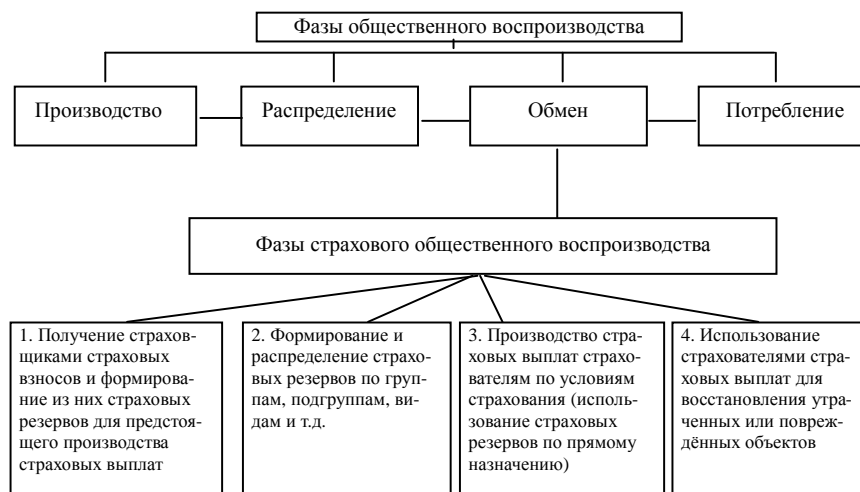
Рис. 4. Основные фазы развития страховых экономических отношений

Как видно, страхование и система его общественных экономических отношений, отталкиваясь от фазы перераспределения (обмена) национального дохода, начинают собственное воспроизводственное бытие, состоящее из четырёх фаз.