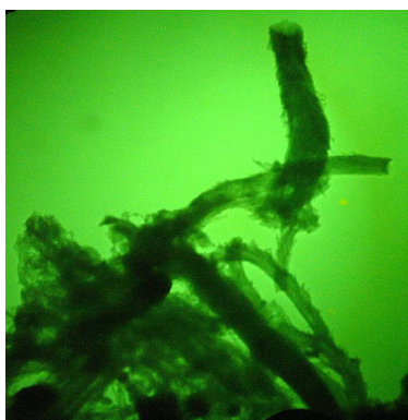
Рис. 2. Фотографии нановолокон, полученных методом пиролитического разложения углеродосодержащих газов