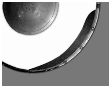
Рис. 3 Снимок движения сыпучего материала после цифровой обработки

С помощью графического редактора Adobe Photoshop 6.0 мы обработали полученное изображение. На рис. 3 представлен полученный результат, где отчетливо видны границы кривой, ограничивающей циркуляционный контур сыпучего материала.