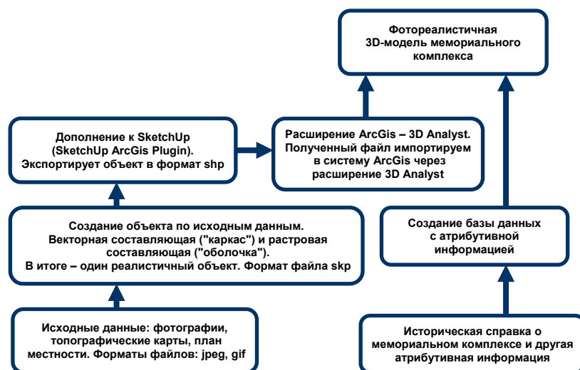
Рис. 1. Функциональная схема создания 3D-модели объекта

В начале создадим геометрическую модель мемориального комплекса с учетом реальных размеров. Используя элементы стандартной базы SketchUp (деревья, кустарники, уличные фонари и др.), придадим нашей модели вид, приближенный к реальному. Инструментами SketchUp «натянем» на геометрическую модель фотореалистичные текстуры, полученные при помощи цифровой фотосъемки. Далее осуществляется экспорт модели объекта в формат, поддерживаемый ArcGis. Таким образом, при помощи продукции компании Google-Sketchup получили фотореалистичную 3D-модель мемориального комплекса в Arcgis.