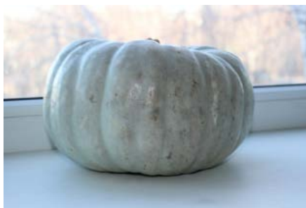
Рис. 1. Тыква сорта «Мичуринская»

Тыква данного сорта уникальна по своему составу и свойствам. В Тамбовской области ее выращивают ООО «ТЭМП», ряд КФХ, ФГБОУ ВО «Мичуринский ГАУ» на экспериментальных полях. Тыква сорта «Мичуринская» районирована и выращивается в 16 регионах России. Ее селекцией и изучением около 50 лет занимался профессор Ю. Г. Скрипников. Данный сорт ценен высокой урожайностью и питательной ценностью. Крупные плоды имеют высокие вкусовые качества и устойчивы к засухе. Период от полных всходов до уборки 96 – 106 дней. Мякоть оранжевая, средней толщины, плотная, очень нежная, сладкая. Содержание сухого вещества 23...25%, общего сахара 5,8...9,5%, каротина 5,2...7,7 мг на 100 г сырого вещества. Максимальная сахаристость плодов наступает после 30 – 60 дней хранения. Товарная урожайность плодов 24,3...51,9 т/га [1].