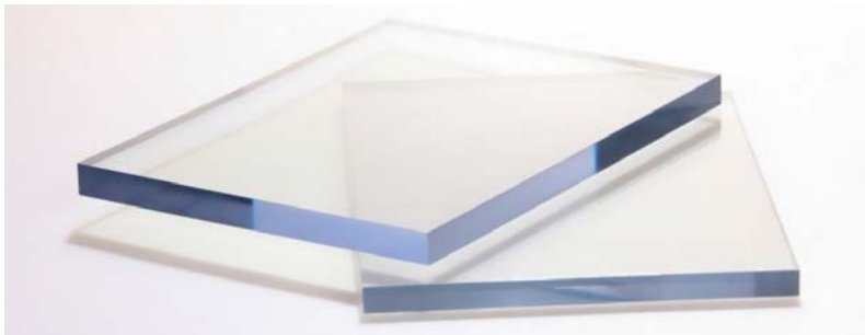
Рис. 1. Органическое стекло (оргстекло)

Органическое стекло (полиметилметакрилат) или известное в других странах как акрил или плексиглас – это синтетический материал, представляющий виниловый полимер метилметакрилата. Листовое акриловое (органическое) стекло представляет собой прозрачные, светонепроницаемые или светорассеивающие с разной степенью светопропускания листы (рис. 1) с идеально глянцевой поверхностью с обеих сторон толщиной от 1,5 до 25 мм.