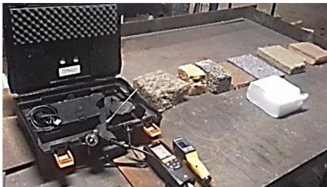
Рис. 1. Приборы и теплоизоляционные материалы, использованные в эксперименте

Для выполнения съемки теплового поля поверхности материала, как в естественном, так и в нагреваемом состоянии, был использован прибор тепловизор марки «FLUKE».