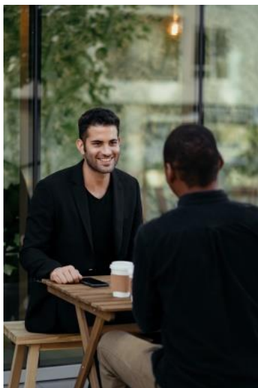
Друзья разговаривают, встретившись в кафе.