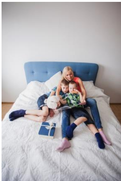
Они читают книгу, лёжа на кровати.