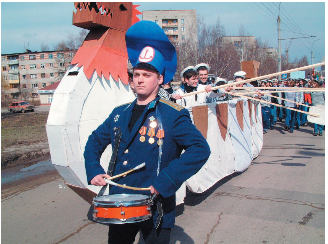
Воспитательная и социальная деятельность